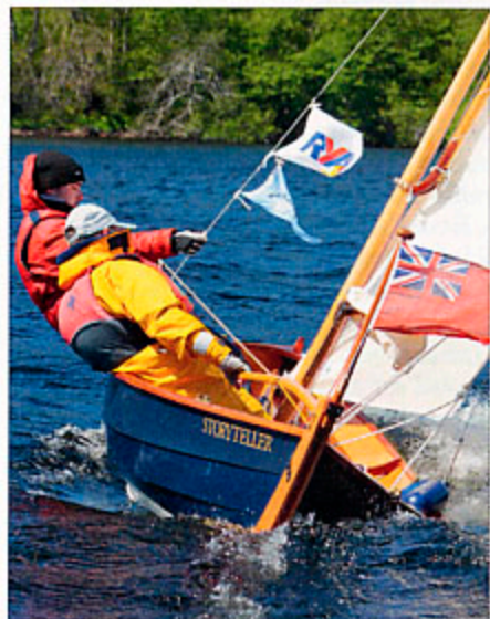
▲ Bas sur l'eau et presque entièrement ouvert, Storyteller connaîtra un raid particulièrement humide!