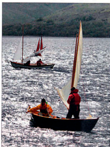
▲ Première navigation sur l'Atlantique et premiers contre-jours sur les eaux sombres du loch Linnhe.