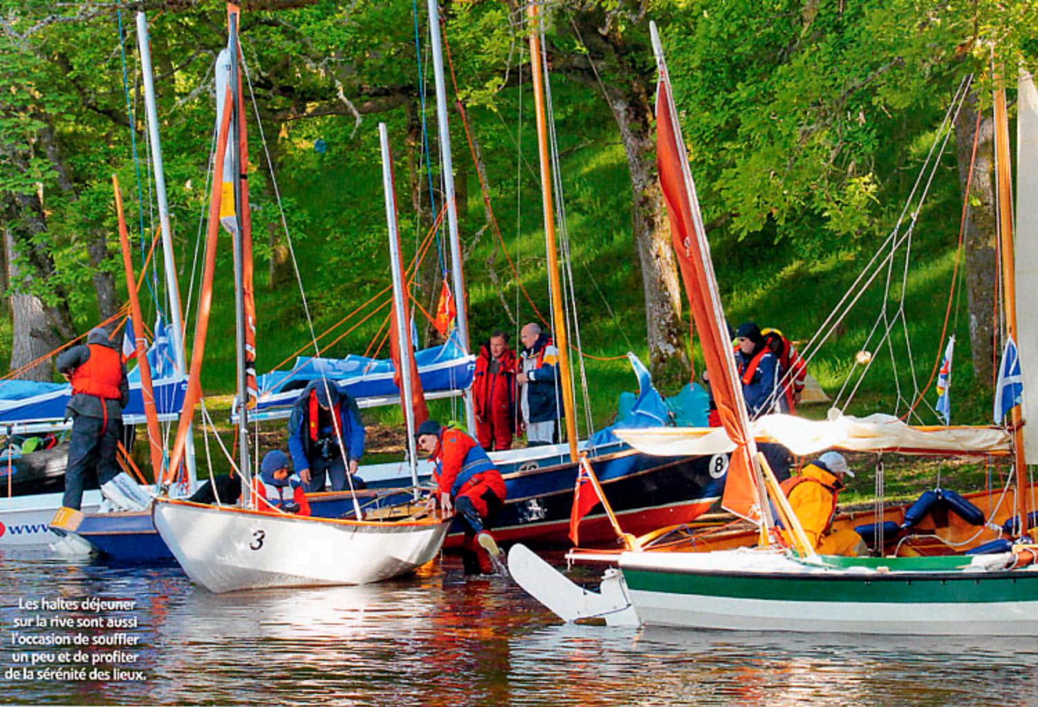
Les haltes déjeuner sur la rive sont aussi l'occasion de souffler un peu et de profiter de la sérénité des lieux.