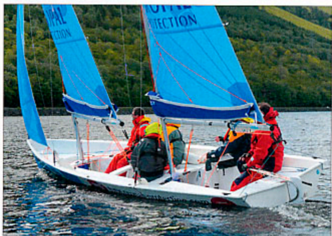
▲ Le Mercator a prouvé que son programme pouvait aller bien au-delà de celui pour lequel il a été conçu.

pas à la relance. Bien que non conçu pour cet usage, le Mercator est tout aussi brillant à l'aviron puisqu'il a fini toutes les courses dans les trois premières places, avec un matériel monté à la hâte, sans repose-pieds ni banc de nage adéquat. Si l'équation nautique sécurité/confort/vitesse/facilité de manœuvre est brillamment résolue, des problèmes de finition assombrissent le tableau. La fabrication des éléments stratifiés ne souffre aucune critique (à l'exception d'un antidérapant moulé peu efficace), mais l'équipement semble présenter des faiblesses : rupture du câble de relevage de la dérive, rupture des deux estropes de hale-bas de GV, sous-dimensionnement et inefficacité chronique des taquets de drisse, fuite au vide-vite arrière (d'ailleurs inutile)... Même si notre expédition a mis le matériel à rude épreuve, certains détails de finition agacent un peu, comme l'absence d'anguiller dans les varangues qui transforme systématiquement le fond du bateau en pédiluve ou la barre