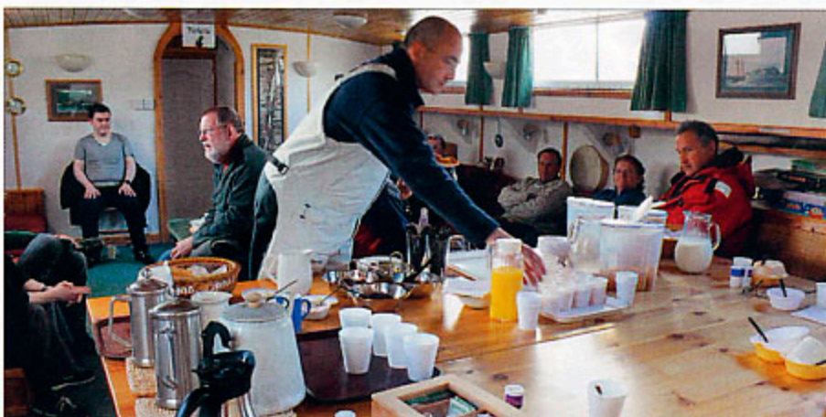
▲ La fameuse péniche du comité d'organisation servait aussi de cantine aux concurrents du raid, assurés de pouvoir y trouver un abri au sec et au chaud : un vrai luxe au pays des fantômes.

marque la fin du canal et l'ouverture aux eaux de la mer du Nord. Curiosité locale, elle est ornée d'une pendule en trompe-l'œil, dont les aiguilles peintes indiquent 16 h 55, l'heure de la débauche ! Bateaux encore dans le sas, John donne ses consignes aux skippers pour la dernière régates du raid. Un fort courant de marée s'invite à l'extrémité du môle, qui donnera du fil à retordre à une majorité de participants pour pouvoir franchir la ligne. La régates finie, il faut songer à remonter les bateaux sur les remorques avant de ramener les attelages par la route au bivouac de Dochgarroch. Puis passage à la salle des fêtes du village pour assister à la remise des prix. Le lendemain, le retour vers la France sera tout aussi interminable que l'aller mais chacun d'entre nous garde en mémoire les images les plus marquantes d'une randonnée pas comme les autres. ■