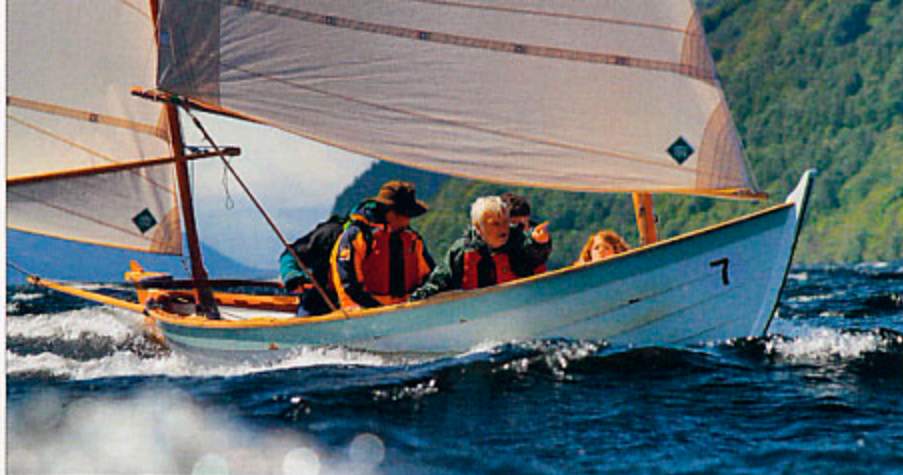
▲ Le suroît qui souffle sur le loch Ness finit par lever un clapot creux et très court, qui anime la surface de l'eau et donne des sensations fortes à l'équipage.