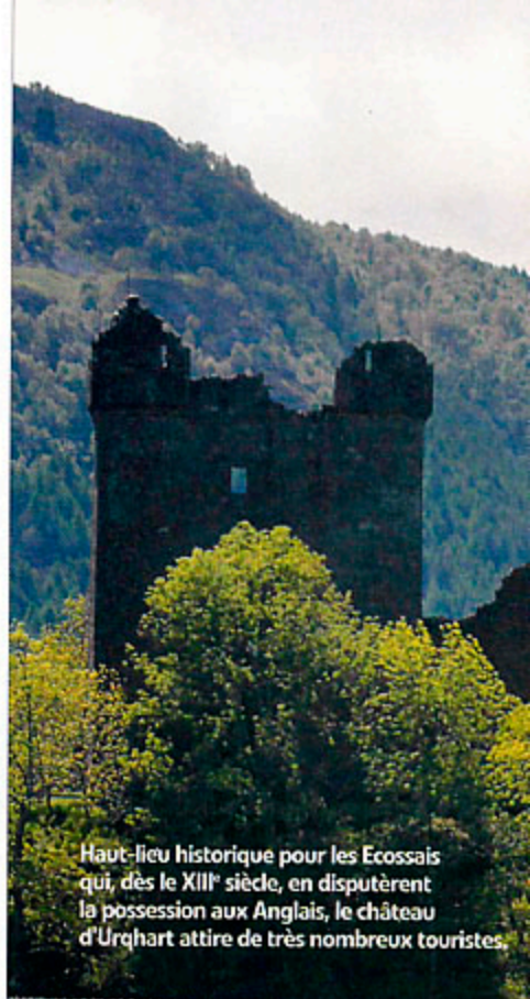
Haut-lieu historique pour les Ecossois qui, dès le XIII e siècle, en disputèrent la possession aux Anglais, le château d'Urquhart attire de très nombreux touristes.